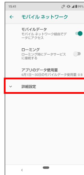
④「詳細設定」をタップ