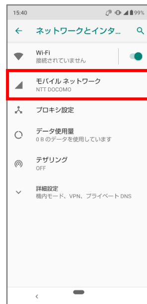
③「モバイルネットワーク」をタップ