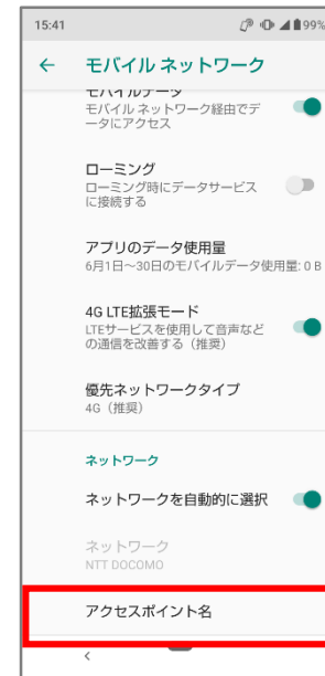
⑤「アクセスポイント名」をタップ