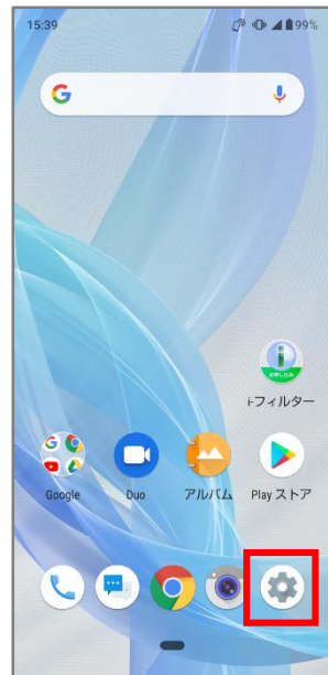
①アプリの一覧より「設定」をタップします。