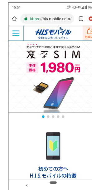
⑧「ブラウザ」アプリを起動してインターネットに接続されていることを確認します。