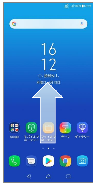
①ホーム画面を下から上へスワイプ。