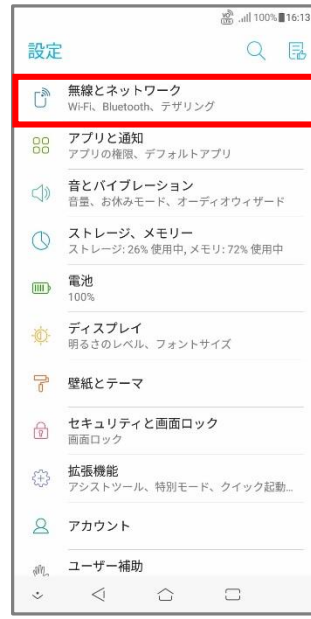
③「無線とネットワーク」をタップ