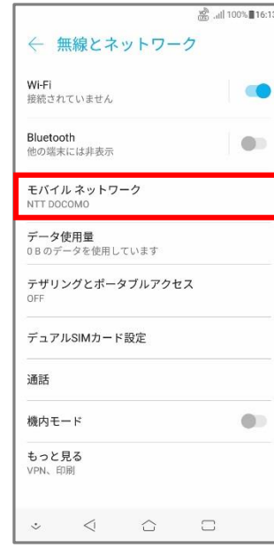
④「モバイルネットワーク」をタップ