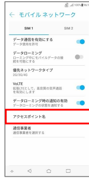
⑤「アクセスポイント名」をタップ