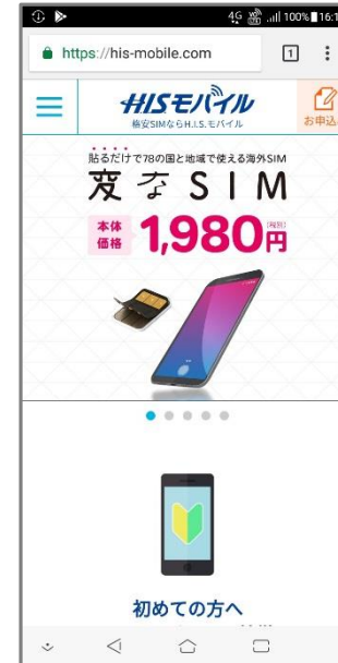
⑨「ブラウザ」アプリを起動してインターネットに接続されていることを確認します。