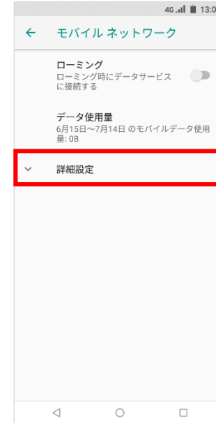
⑤「詳細設定」をタップ