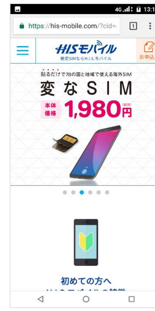
⑩「ブラウザ」アプリを起動してインターネットに接続されていることを確認します。