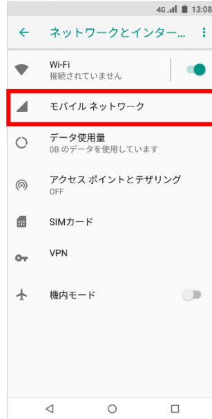
④「モバイルネットワーク」をタップ