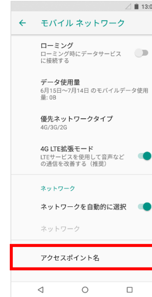
⑥「アクセスポイント名」をタップ