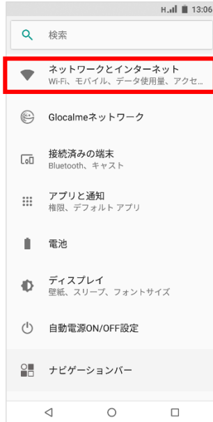
③「ネットワークとインターネット」をタップ