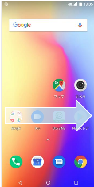
①ホーム画面をスワイプ